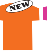
7.サンセットオレンジ