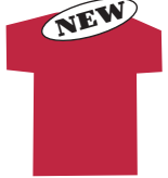
3.ガーネットレッド