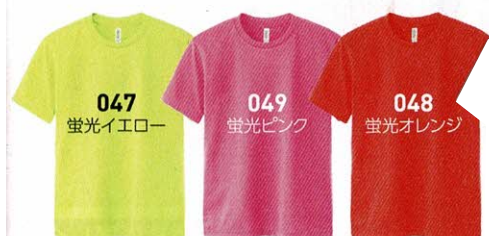
Tシャツカラーサンプル (現物と多少色が違う場合があります)