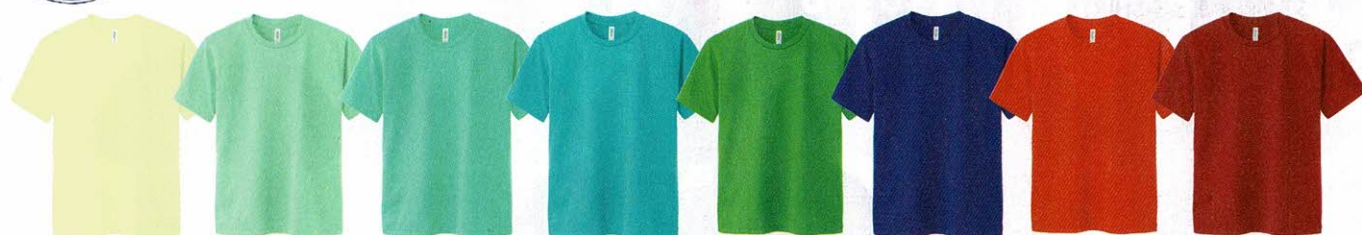
134 ライトイエロー 027 メロン 026 ミントグリーン 096 ミントブルー 194 ブライトグリーン 171 ジャパンブルー 038 サンセットオレンジ 035 ガーネットレッド