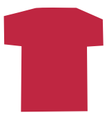
3.ガーネットレッド